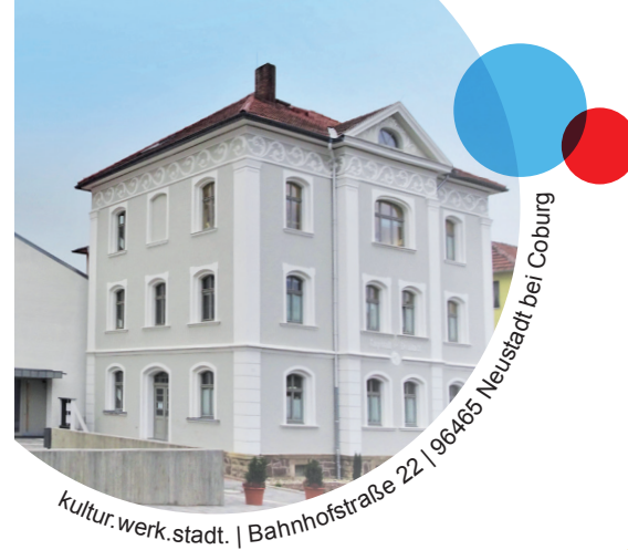
kultur.werk.stadt. | Bahnhofstraße 22 | 96465 Neustadt bei Coburg

Zertifiziert nach AZAV Zertifikat-Registrier-Nr. A 180300101-V2