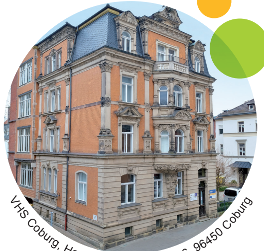
VHS Coburg, Haus 2, Löwenstraße 16, 96450 Coburg

Kontakt Volkshochschule Coburg Löwenstraße 15 96450 Coburg info@vhs-coburg.de